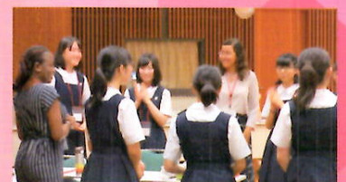
夏の国際交流プログラム